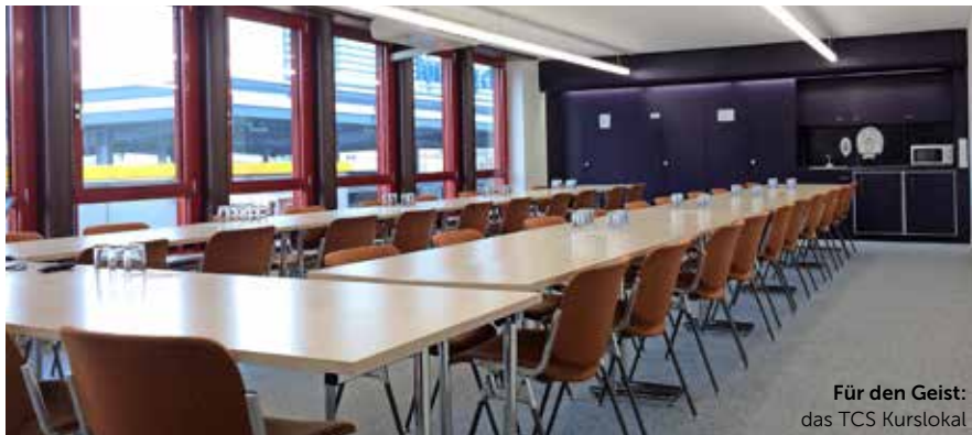
Für den Geist: das TCS Kurslokal