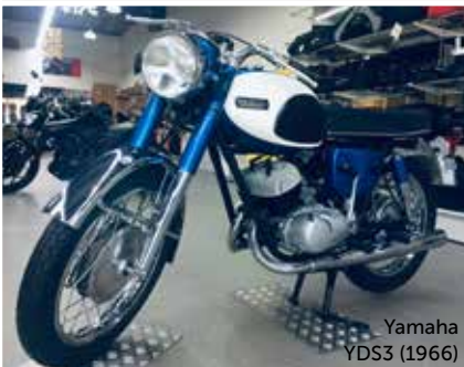
Yamaha YDS3 (1966)