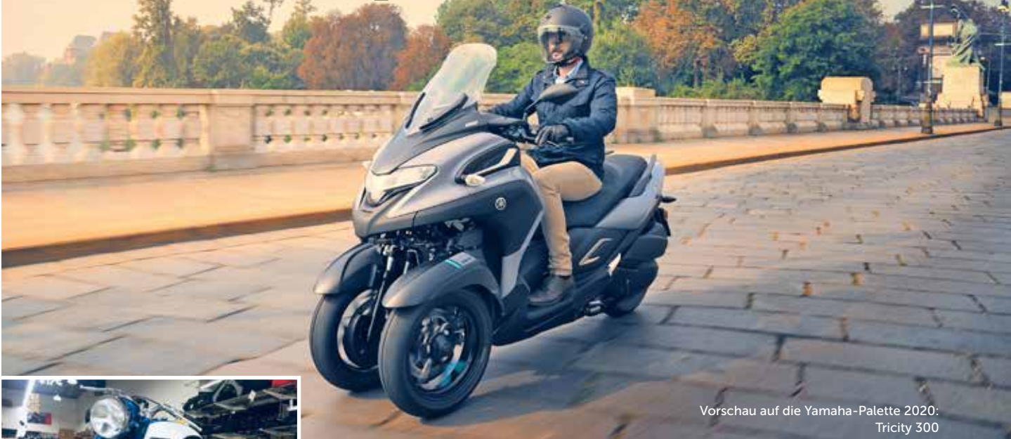
Vorschau auf die Yamaha-Palette 2020: Tricity 300