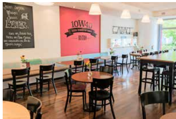
Für den Magen: das Bistro «10W40»

lung) und direkt im Haus das Bistro «10W40» für die Kaffeepausen und das Mittagessen. Gutes für Geist und Magen zum attraktiven Preis ab Fr. 75.– pro Teilnehmer – alles inklusive. Natürlich kann das Kurslokal auch ohne Verpflegung gebucht werden.