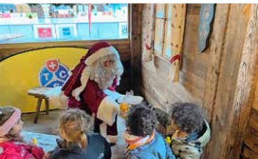
10.12.2024 TCS-Chlouser-Nachmittag / Après-midi TCS Saint-Nicolas