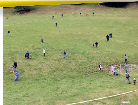
Les troupes sont déployées dans le terrain.