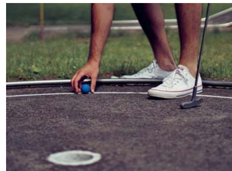
Les amateurs de minigolf pourront s'en donner à cœur joie en août prochain.

En cas de mauvaises conditions météorologiques, le minigolf peut être fermé. Merci de consulter nos réseaux sociaux en temps voulu pour s'assurer que la manifestation est bien maintenue.