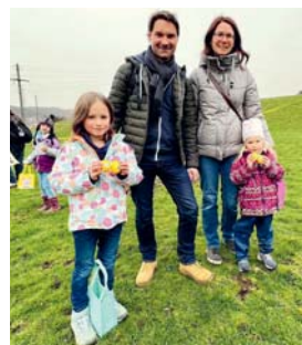
Les familles auront pris beaucoup de plaisir à cette première chasse aux œufs.