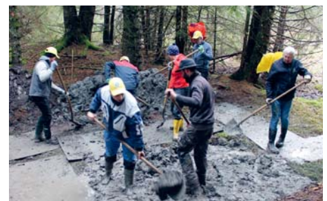
Le labeur touche à sa fin. DW