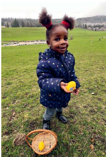
Le TCS se cache dans les moindres détails, y compris sur des coquilles d'œufs!