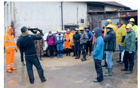
À l'heure du briefing matinal d'une journée exceptionnelle – une première, en fait – pour la Section jurassienne du TCS. DW