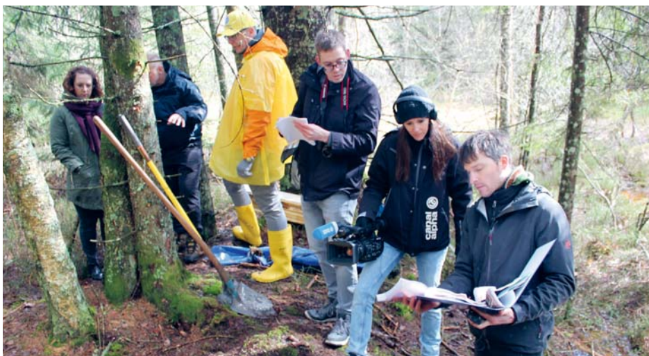
L'événement a bénéficié d'une belle couverture médiatique régionale. DW