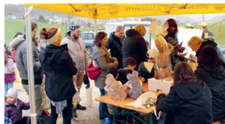
À l'heure de la remise des prix.