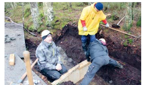
Sur certains postes, un véritable exercice d'équilibriste... DW