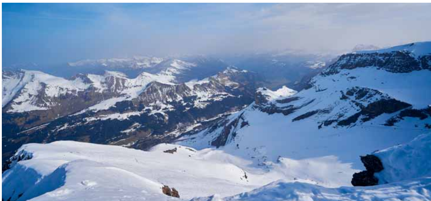
Le cadre enchanteur des Diablerets vous attend!