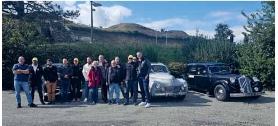
Les membres du comité et des commissions de la Section jurassienne du TCS posent aux côtés des véhicules anciens, lors de la balade organisée dans ces véhicules dans le Pays de Montbéliard le 14 septembre dernier (ici au fort du Mont-Bart, à Bavans).

L'après-midi a réservé aux participants une expérience unique : une balade en voiture ancienne à travers les paysages pittoresques et les principaux lieux historiques de la région, grâce au club des Vieux Volants francs-comtois.