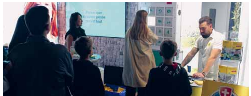
Certains soirs, l'affluence était copieuse. La preuve!

membres du bureau, du comité et des commissions de la section, a su attirer l'attention des visiteurs, partageant conseils et informations sur la mobilité et les voyages en toute sécurité, en mettant en avant les synergies entre le TCS et Swica, qui valorisent la santé et la prévention au volant notamment.