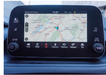
Schermo tattile funzionale Gestisce il menu dell'intrattenimento e il navigatore.

Era prevedibile: la Tipo non è affatto una GTI. Sebbene quindi non sia la sua vocazione, il telaio dimostra un'eccellente tenuta. Ben piantato a terra, offre sensazioni di guida rassicuranti. E se si alza il ritmo, questa compatta dimostra una stabilità senza difetti. Se necessario, l'ESP interviene in finezza. Ciò detto, l'asse anteriore per nulla incisivo e soprattutto lo sterzo insensibile fanno presto a smorzare gli ardori risvegliati dal telaio. Spiace ancora di più se si pensa che l'impianto frenante, potente e reattivo, avrebbe del potenziale.