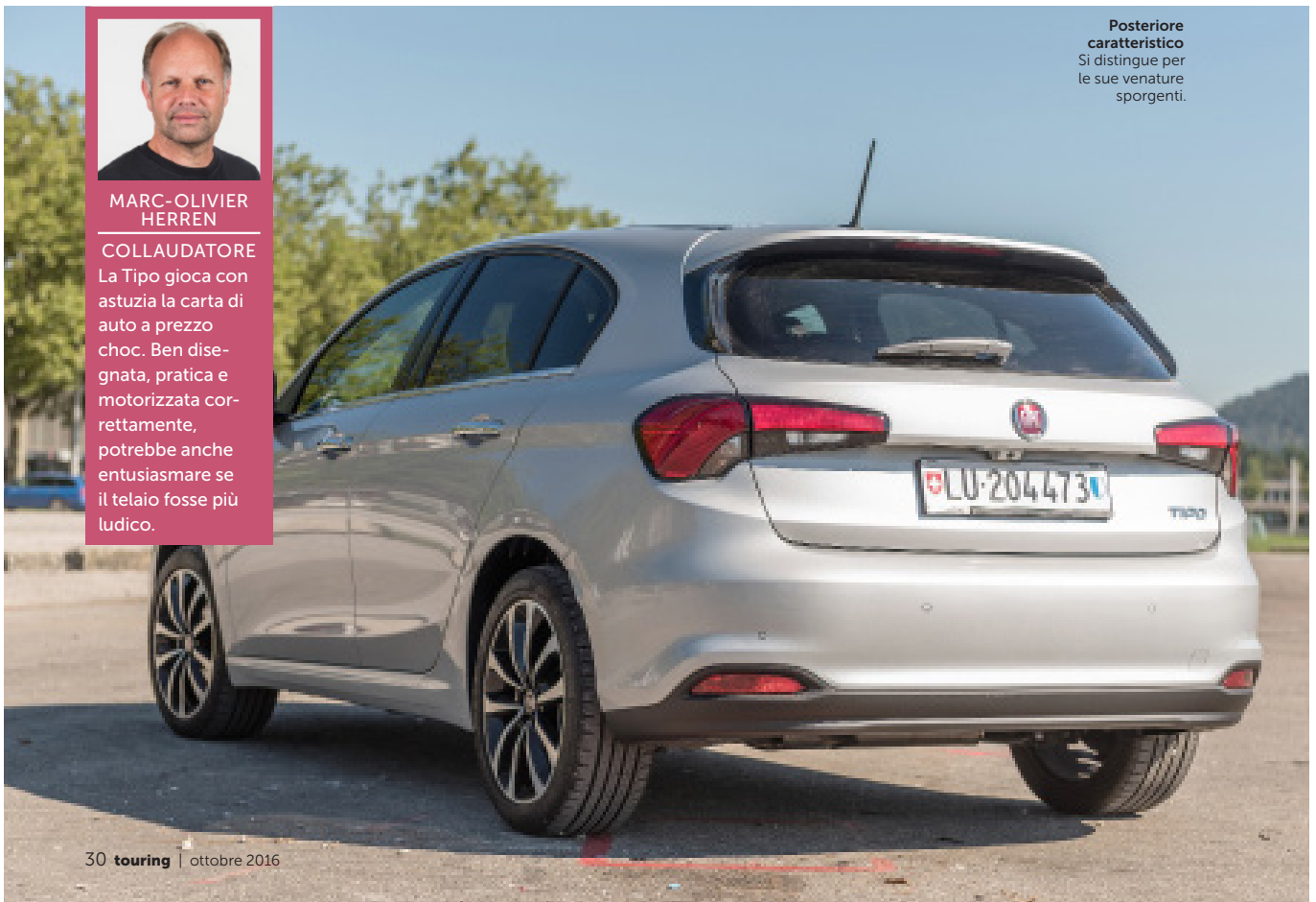
Posteriore caratteristico Si distingue per le sue venature sporgenti.

La Tipo gioca con astuzia la carta di auto a prezzo choc. Ben disegnata, pratica e motorizzata correttamente, potrebbe anche entusiasmare se il telaio fosse più ludico.