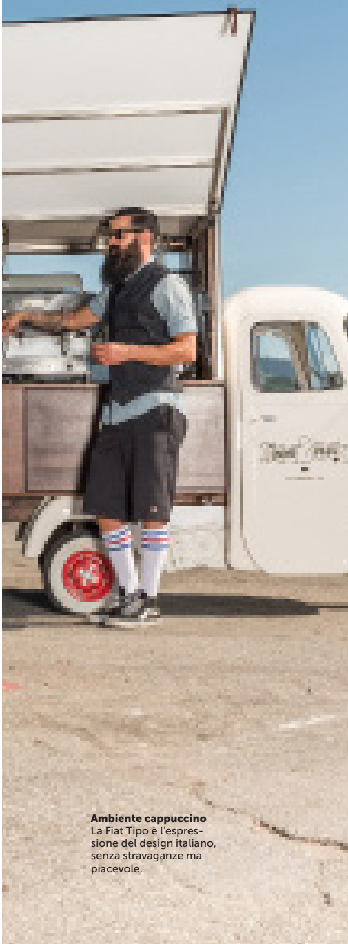
Ambiente cappuccino La Fiat Tipo è l'espressione del design italiano, senza stravaganze ma piacevole.

U n'auto equilibrata e molto ben equipaggiata per circa 21 000 fr.: difficile fare meglio, tanto più nella categoria molto concorrenziale delle compatte. Piuttosto che voler plagiare l'inarrivabile VW Golf, Fiat si è per finire decisa a riproporre le ricette che hanno fatto il successo dell'auto italiana: semplicità, prestazioni e prezzi modici. Unico strappo con la tradizione, la Fiat Tipo è fabbricata in Turchia. Ebbene sì, la globalizzazione è passata anche da qui. Un male minore se consideriamo che il modello Lounge è dotato di un bello