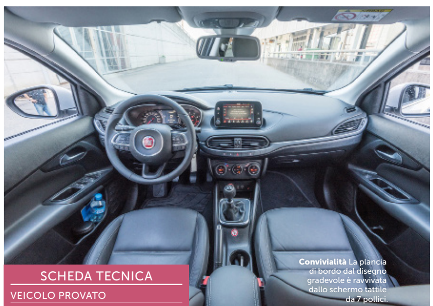
Convivialità La plancia di bordo dal disegno gradevole è ravvivata dallo schermo tattile da 7 pollici.