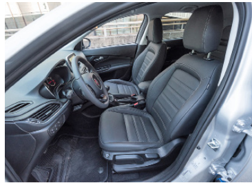
Selleria in pelle controversa Alcuni del team non erano a loro agio. Altri, l'hanno apprezzata.

I 4,37 metri della vettura sono utilizzati giudiziosamente. Facilmente accessibile, il divanetto posteriore regala ai passeggeri un ampio spazio per le gambe. Le sedute sono un po' giuste e gli schienali relativamente dritti, ma il comfort è buono, eccezion fatta per il posto centrale, rigido e anche stretto. Davanti, i sedili in pelle opzionali offrono una tenuta lacunosa ma sono comodi. Da buona auto economica, la Tipo si accontenta di una barra di torsione dietro. A tutto vantaggio del bagagliaio, che con 440 l, distanzia la quasi totalità della concorrenza. A parte la presenza di una soglia, non troppo fastidiosa, questo baule cubico si rivela pratico. Ed il suo rivestimento è di fattura interessante. Peccato che il piano di carico sia pena-